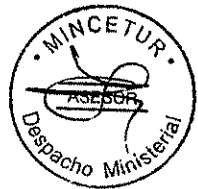
JOSE LUIS SILVA MARTINOT Ministro de Comercio Exterior y Turismo

DOCUMENTO AUTENTICADO "ES COPIA FIEL DEL ORIGINAL"